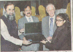
انجینئر بلخ الرحمن وفاقی تعلیمی بورڈ میں پوزیشن ہولڈر طلبہ میں لیپ ٹاپ تقسیم کر رہے ہیں

اسلام آباد ((اپنے رپورٹر سے وزیر مملکت برائے تعلیم انجینئر محمد بلخ الرحمن نے کہا ہے کہ پوزیشن ہولڈر طلباء کو فیڈرل بورڈ کے تحت بیرون ملک تعلیم کیلئے قرض حسنہ کی سہولت دی جائے گی، ذہین طلباء کی حوصلہ افزائی کے لئے وقفہ 50 ہزار سالانہ تک بڑھا دیا ہے جبکہ میرٹک میں پہلی تین پوزیشن لینے والے طلباء کو ایک لاکھ تک، انٹرمیڈیٹ کے طلباء کو 2 لاکھ تک کے نقد انعامات اور لیپ ٹاپ دیئے جائیں گے۔ ان خیالات کا اظہار انہوں نے جمعرات کو فیڈرل بورڈ آف انٹرمیڈیٹ اینڈ سیکنڈری ایجوکیشن میں ورکشاپ اور لیپ ٹاپ تقسیم کرنے کی تقریب سے خطاب کرتے ہوئے کیا۔ درس اٹنا، جمعیت طلباء کے زیر اہتمام سینیٹ سے خطاب کرتے ہوئے انجینئر بلخ الرحمن نے کہا ہے کہ ہائر ایجوکیشن کمیشن کے بجٹ 141 ارب سے بڑھا کر 182 ارب کر دیا آئندہ