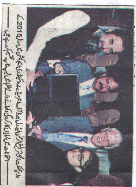
وزیر تعلیم شیخ ارحمان، چیف سیکریٹری تعلیم شیخ ارحمان، چیف سیکریٹری صحت شیخ ارحمان اور دیگر افسران کے ساتھ

ایچ ای سی بجٹ ۱۹۱۲ کرے گی۔ وزیر تعلیم شیخ ارحمان کا ایک نیا تقرر سے خطاب