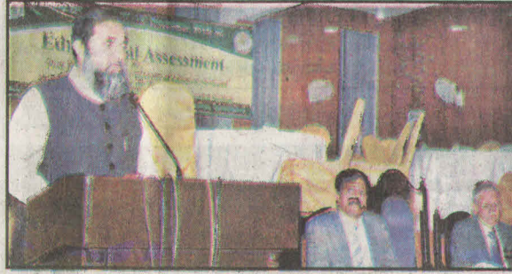
اسلام آباد: وزیر مملکت انجینئر بلوغ الرحمن لپ ٹاپ تقریب کرنے کی تقریب سے خطاب کر رہے ہیں

تربیت بھی دیں گے، آئی ایم ایف سے جان چھرائی سے اس پر متفق ہیں کہ ملک میں بہتری آئی ہے آج کا پاکستان برائے پاکستان سے بہتر ہے۔