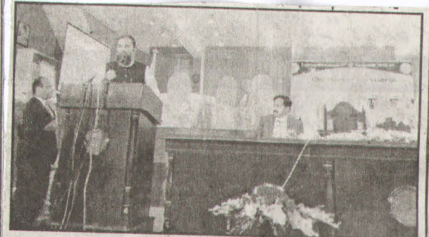
اسلام آباد: وزیر تعلیم انجینئر بلوغ الرحمن لپ ٹاپ تقسیم کی مشق سے تقریب سے خطاب کر رہے ہیں